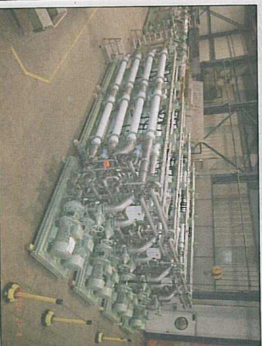
Hamworthy's MBR main process tanks being positioned at Meyer Werft, Papenburg.

Hamworthy Water Systems has delivered its largest ever Membrane Bioreactor (MBR) wastewater treatment plant for installation onboard a cruise ship.